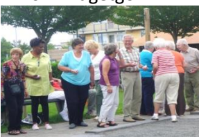
07-08 Jeu de Boules