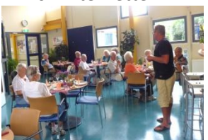
07-08 Koken + Lunch