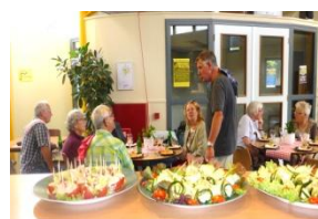
15-07 Koken + Lunch